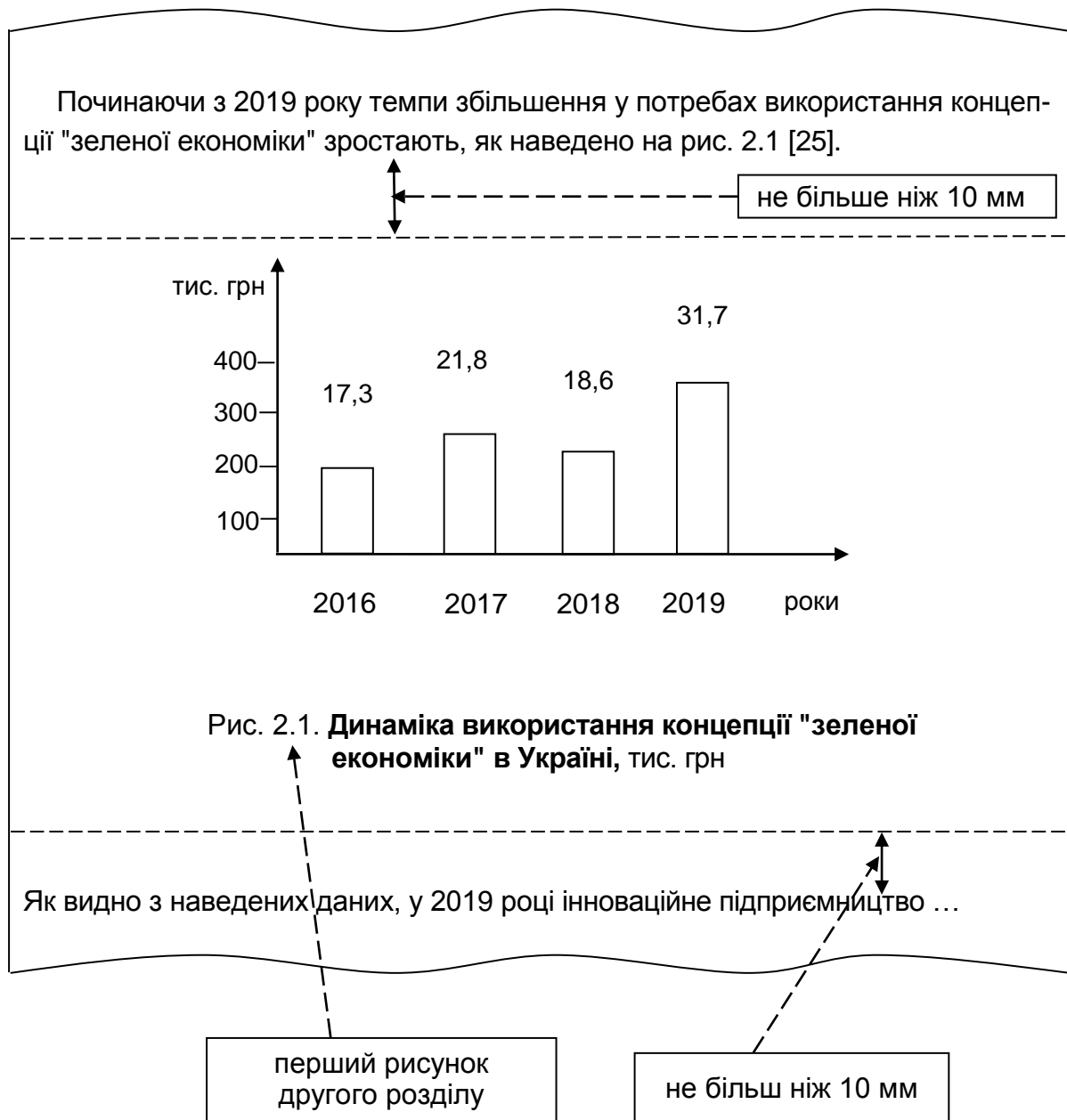
Рис. 4. Наочне подання оформлення ілюстрацій у курсовій роботі

Номер таблиці повинен складатися з номера розділу і порядкового номера таблиці, наприклад: "Таблиця 1.1" (перша таблиця першого розділу). Заголовки граф мають починатися з великих літер, а підзаголовки – з маленьких. У разі перенесення частини таблиці на інший аркуш (сторінку) пишуть слова "Закінчення табл." і вказують номер таблиці, наприклад "Закінчення табл. 1.2", а роль шапки таблиці у цьому випадку відіграє цифровий порядок. Якщо цифрові або інші дані в якому-небудь рядку таблиці не подають, то в ньому ставлять прочерк (рис. 5).