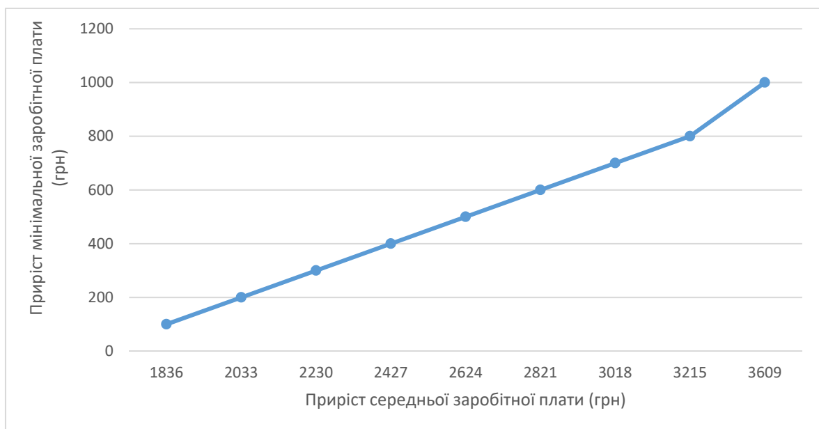
Рисунок 1. Залежність приросту середньої заробітної плати від приросту мінімальної (грн)

Таким чином навіть незначне підвищення мінімальної заробітної плати (наприклад, на 200 грн) призведе до суттєвого збільшення середньої (на 2.033 грн), а це, в свою чергу до зростання рівня цін на 12% (темпу росту середньої заробітної плати досягне 122\% (2.033+9.218)/9.218=1.22 ), а приріст інфляції – 12.1\% (22\%*0.55) .