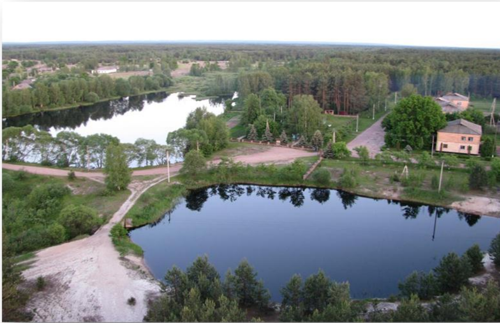
Рис. 3 Поліський природний заповідник