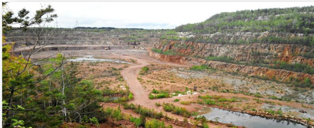
Рис. 4 Словечансько-Овруцький кряж