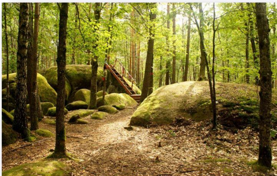
Рис. 2 Геологічний заказник державного значення «Камінне село»