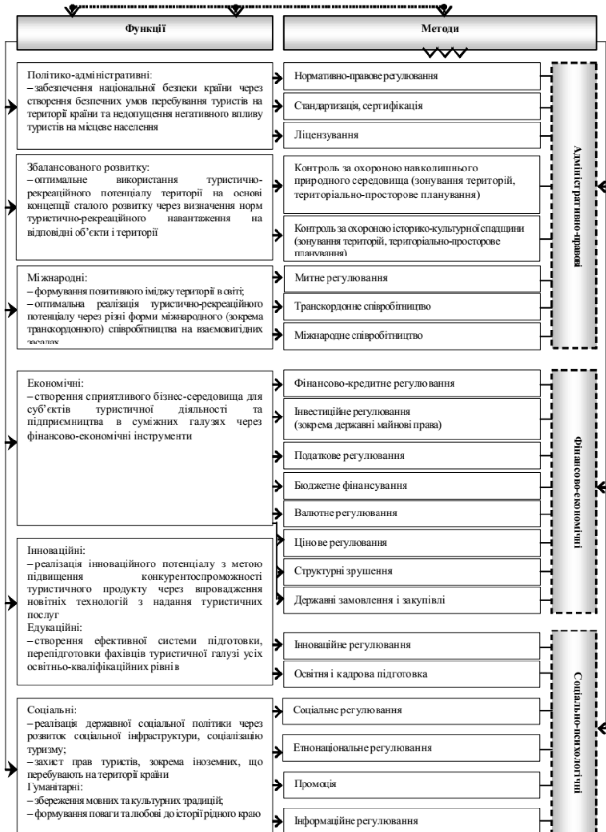
Рисунок 2.1 – Функції та методи державного регулювання розвитку туризму [8]