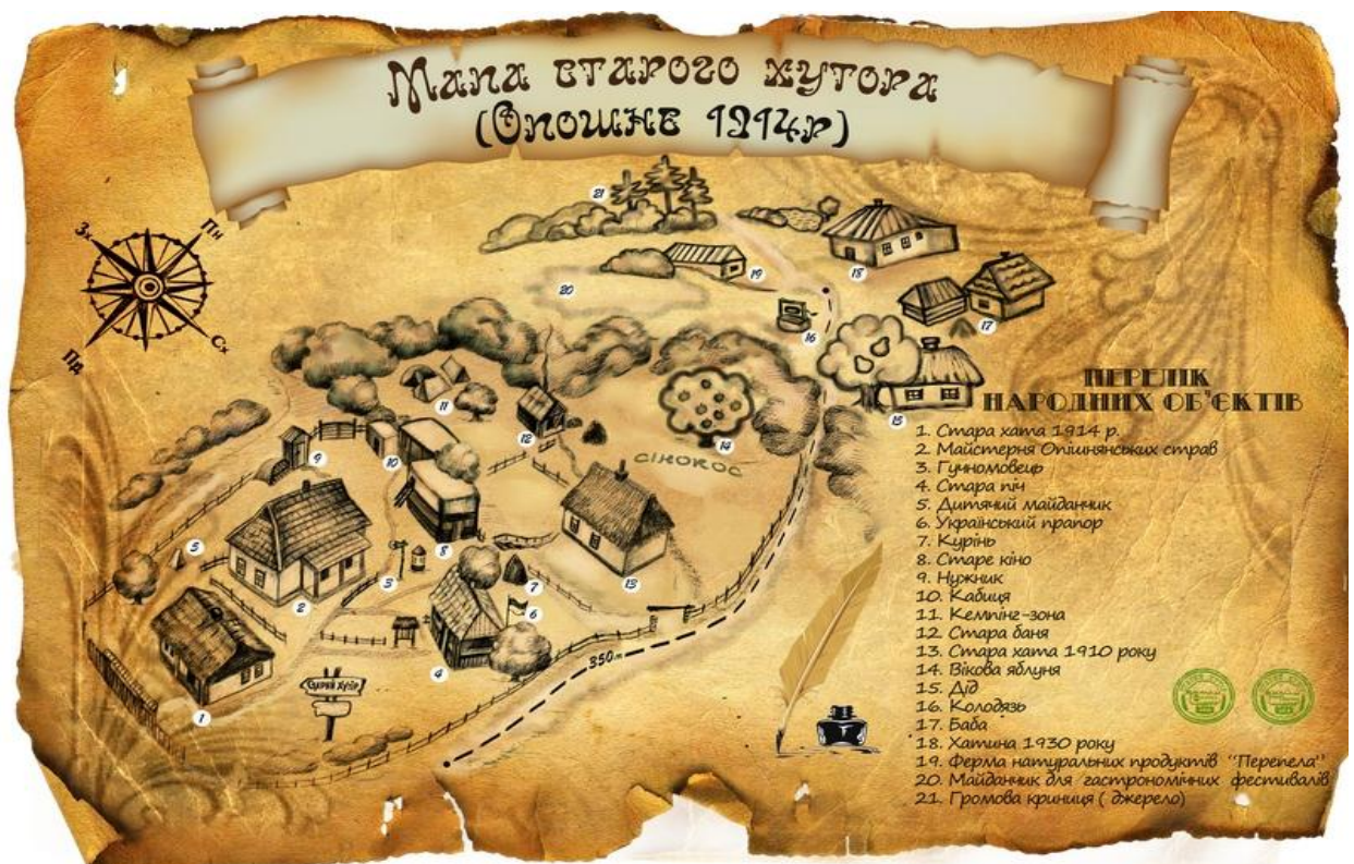
Рис.6. «Мапа садиби «Старий хутір»

Мапа «Старого Хутора» наведена на мал. 6.