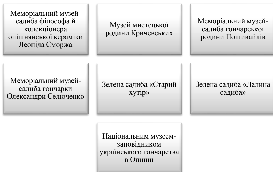
Рис.3.Основні туристичні об'єкти

Офіційно щорічно відбувається науково- мистецька акція національного масштабу, спрямованої на пізнання традицій і досягнень гончарної культури, розвиток сучасного гончарства та популяризацію мистецтва кераміки в Україні.