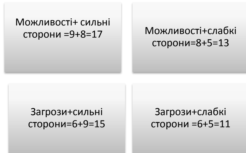
Рис.5. Матриця SWOT- аналізу туристичного потенціалу м.Опішня

Таким чином, ми можемо зробити висновок, що м.Опішнє має потенціал та можливості для подальшого розвитку. Недоліком для соціально-економічного обґрунтування стратегії розвитку є відсутність офіційної статистики, яка б дозволила продемонструвати. Однак, за офіційними даними, що оприлюднює керівництво Національного музею-заповідника українського гончарства в Опішні, то останні три роки відзначається тенденція до збільшення туристичного потоку у два рази. Основним недоліком, що відзначають відвідувачі фестивалів – це брак закладів розміщення як для туристів, так і самих учасників фестивалю. Оскільки у даному регіоні активно представлені здобутки гончарства, то логічним є створення об’єктів екологічного спрямування, що є актуальним на даному етапі. Це дозволило б не тільки розвивати наявний потенціал, але і розвивати екологічні знання не тільки для відвідувачів музеїв, але і місцевого населення, туристів та науковців.