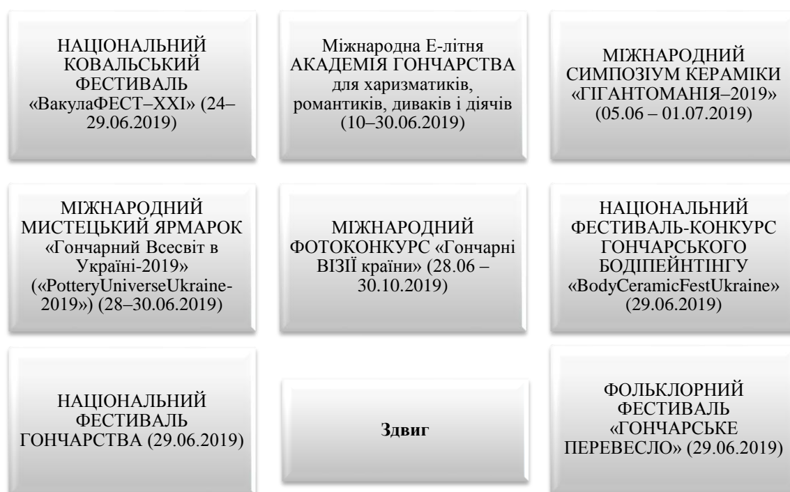
Рис.4.Основні національні фестивалі м.Опішні щорічні

У рамках цього заходу відбувалися фестивалі (рис.4).