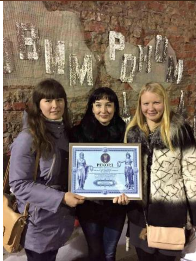
Встановлення Національного рекорду України «Наймасовіше виконання колядки «Ой, хто, хто Миколая любить» жителями та гостями міста Миколаєва