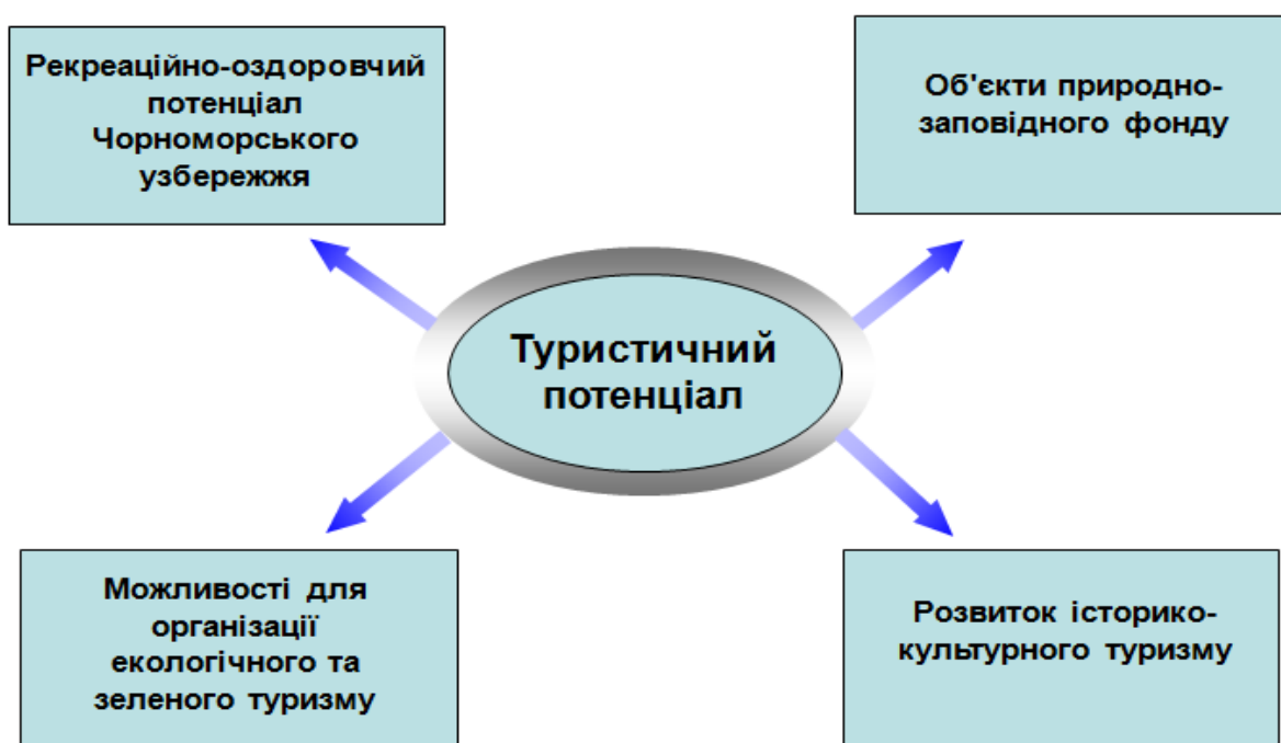
Рис. 2.1 Складові туристичного потенціалу Миколаївської області

Туристичний потенціал Миколаївського регіону включає можливості регіону пропонувати та створювати конкурентоспроможні туристичні продукти, що можуть бути використані для задоволення потреб туристів. Туристичний потенціал регіону складається з наявних чи фактичних туристичних об'єктів та потенційних туристичних продуктів (рис. 2.1).