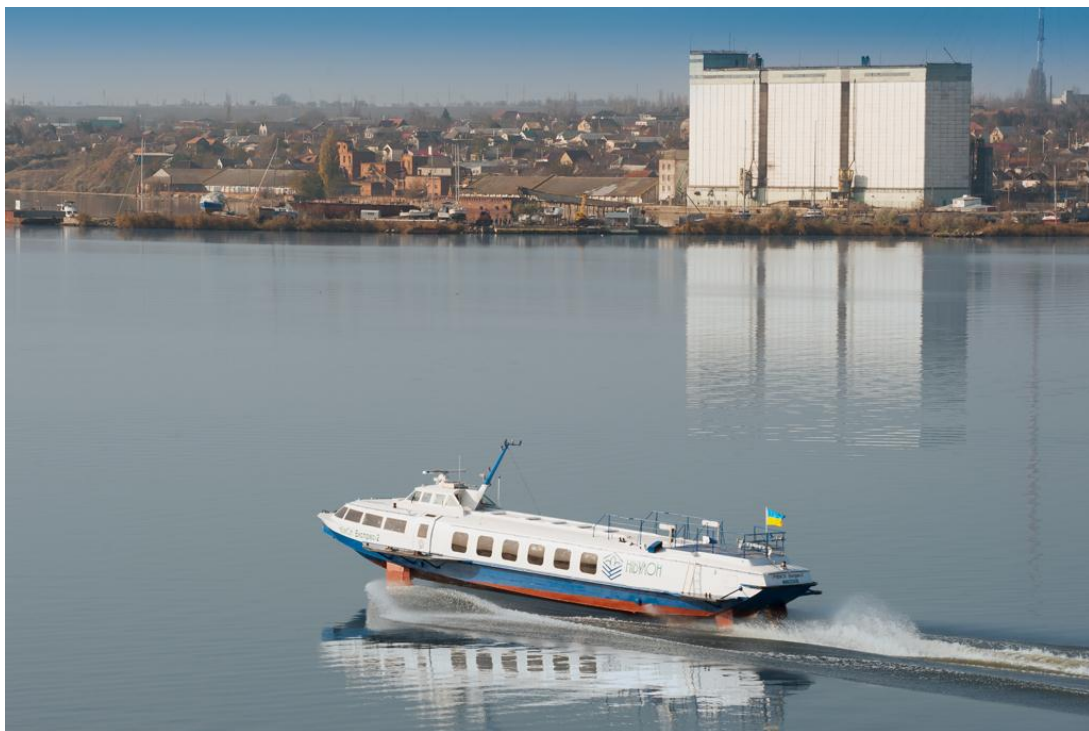
Судно на підводних крилах «НІБУЛОН – експрес» на Південному Бузі