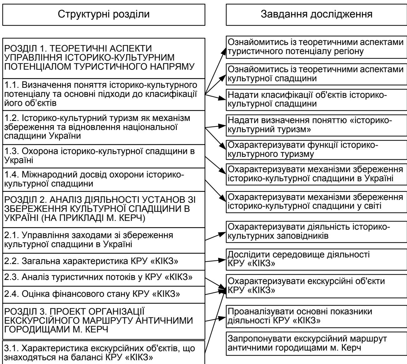
Рис. 3.1. Структурно-логічна схема досліджень

Предмет дослідження: діяльність історико-культурних заповідників як інструменту туристичної інфраструктури регіону