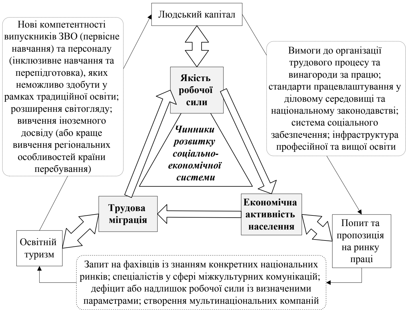
Рис. 1. Взаємозв'язок триади «якість робочої сили – міграція – економічна активність населення»

Щодо сутності триади, представленої на рис. 1, у дисертації зазначено: зміни тенденцій на ринку праці, концепцій організації праці сприяють виникненню її нових форм і видів, що не підпадають під традиційні способи статистичних спостережень, та механізмів регулювання; національні системи вищої освіти знаходяться у стані постійної трансформації і вимушені відповідати на зростаючі вимоги роботодавців, у тому числі міжнародних компаній. В сучасних умовах починають переважати принципово нові форми зайнятості, як-от аутсорсинг та індивідуальне виконання угод, що ускладнює групування пропозиції робочої сили та дослідження стану економічної активності населення, змінюючи структуру ринку праці. Так, в Україні, починаючи із 2019 р., було прийнято декілька принципово нових положень для статистичних обстежень, зокрема, замінено термін «економічно активне населення» на термін «робоча сила», та відмінено верхню вікову межу зайнятості у відповідності до рекомендацій Міжнародної організації праці (МОП). Тому у дисертації причинно-наслідкові взаємозв'язки суб'єктів ринку запропоновано будувати як «освіта – міграція – зайнятість», а традиційне визначення економічно активного населення, що тяжіє до ототожнення із кількісними показниками робочої сили, запропоновано розширити з урахуванням сучасних умов ринку праці та форм її організації.