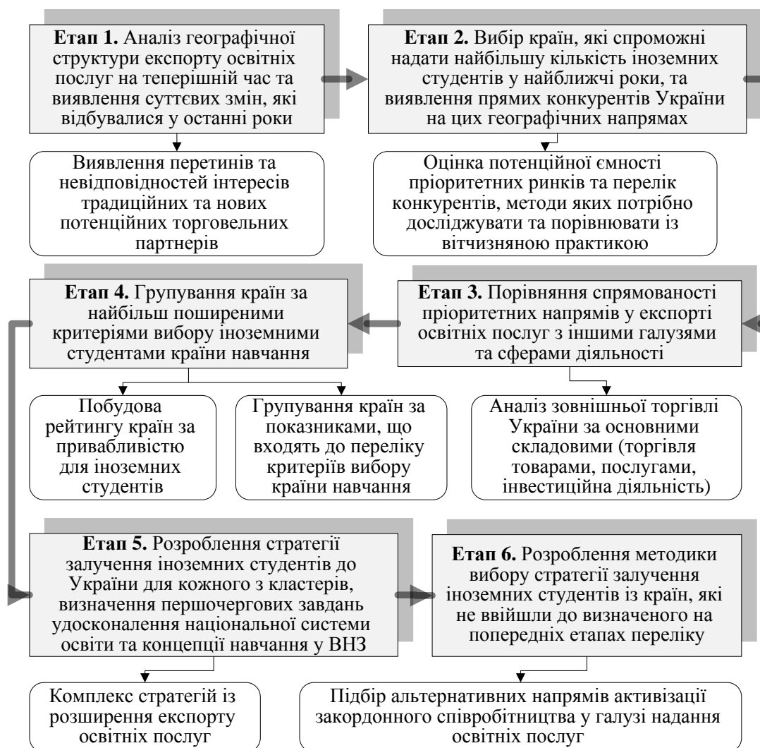
Рис. 2. Методичний підхід до вибору пріоритетних напрямів розвитку освітнього туризму для зростання економічної активності населення

Визначено, що одним із завдань макроекономічного рівня є регулювання чисельності економічно активного населення (пропозиції кваліфікованої робочої сили) через систему вищої освіти за новітніми й перспективними спеціальностями. У дисертації запропоновано послідовність етапів визначення перспективних спеціальностей підготовки фахівців за відповідними напрямками щодо їх приналежності, яка враховує особливості попиту та пропозиції зарубіжних ринків праці щодо експорту та імпорту робочої сили. Запропонована послідовність етапів дозволяє здійснити планування стратегії розвитку системи вищої освіти для забезпечення необхідної чисельності економічно активного населення щодо зростання валового національного продукту та є основою розробленого методичного підходу до вибору пріоритетних напрямів розвитку освітнього туризму для зростання економічної активності населення (рис. 2).